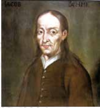
Jakob Böhme (1575 - 16249)

Südlich von Görlitz, im nahe der böhmischen Grenze gelegenen Alt-Seidenberg, wird Jakob Böhme im Jahre 1575 (der genaue Geburtstag konnte nicht mehr ermittelt werden), als viertes Kind einer begüterten Bauernfamilie geboren. Da Jakob von schwächlicher Konstitution ist, kann er nicht Bauer werden und erlernt deshalb das Schusterhandwerk. 1599 erwirbt er das Bürgerrecht von Görlitz, kauft eine „Schuhbank“ und wird in die Schusterinnung aufgenommen.